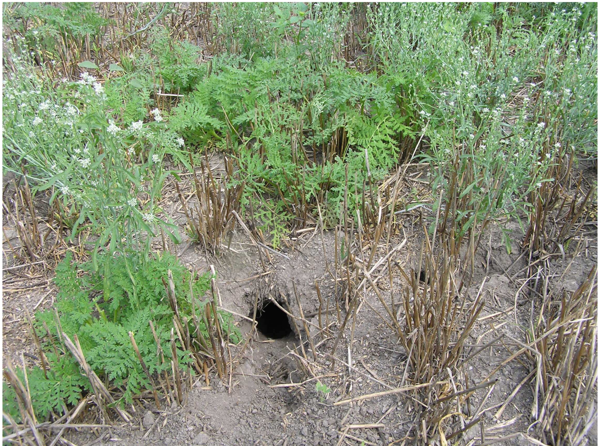
Abb.3: Aufnahme vom 22.8.2012: Mäuse fressen die Begrünungskultur Senf, verschmähen aber Phacelia und Kresse. Kein Problem durch Ausfallgerste

Es wurden aber auch Grenzen dieses Systems sichtbar. Weil keine Bodenbearbeitung nach der Ernte erfolgt, wird auch das Gangsystem von Mäusen nicht zerstört. Auf Flächen mit starkem Mäusedruck kann daher eine Mähdruschaat kritisch sein. Ein geringer Mäusedruck muss aber kein Ausschließungsgrund für die Saat der Zwischenfrucht mit dem Mähdrescher sein. Eine vielfältige Begrünungsmischung kann dazu beitragen, dass trotz Mäusefraß noch eine ganzflächige Begrünung erhalten bleibt. Die Mäuse haben sicherlich auch Ausfallgerste, die an der Bodenoberfläche gelegen ist, gefressen. Im Zusammenwirken mit dem dichten Zwischenfruchtbestand war daher kein Problem durch Ausfallgerste festzustellen.