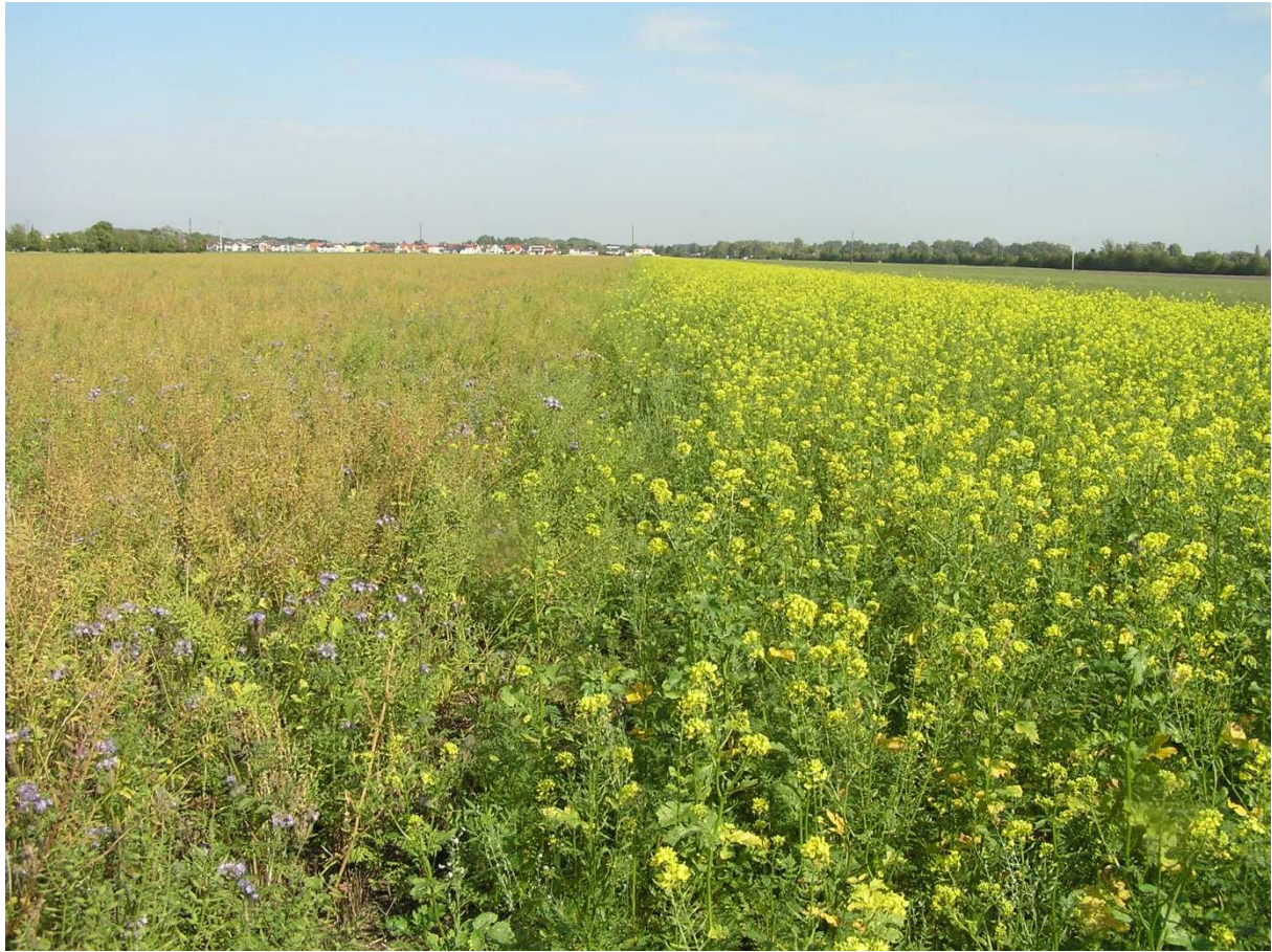
Abb.5: Links: Mähdruschaat am 20.6.2012 – Senf in Abreife Rechts: Saat nach einmal Grubbern Ende Juli – Senf in Vollblüte Aufnahme vom 1.10.2012

Durch die Mähdruschaat und die dadurch ermöglichte frühe Saat konnten manche Zwischenfrüchte sogar keimfähige Samen bilden.