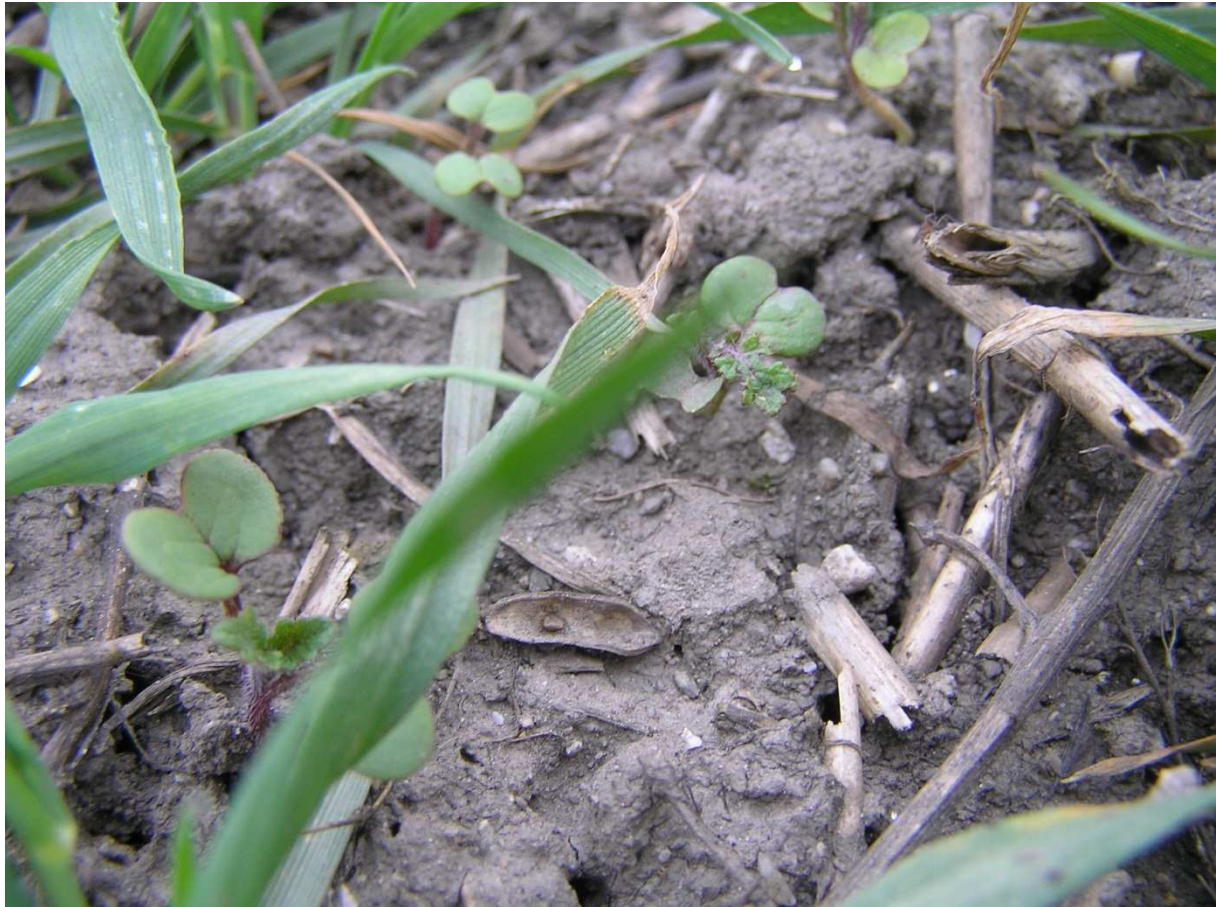
Abb.7: Aufnahme vom 17.4.2013: im Frühjahr gekeimter Senf unter konkurrenzkräftigem Weizen

Im Frühjahr sind die im Herbst gekeimten Senfpflanzen nicht mehr zu finden. Es zeigen sich aber neue Keimlinge. Der Weizen bildet aber schon einen konkurrenzkräftigen Bestand, der sich bei ausreichender Feuchtigkeit und Temperatur weiter bestockt und ins Schossen geht. Es bleibt zu beobachten, wie weit der Senf mitwachsen kann.