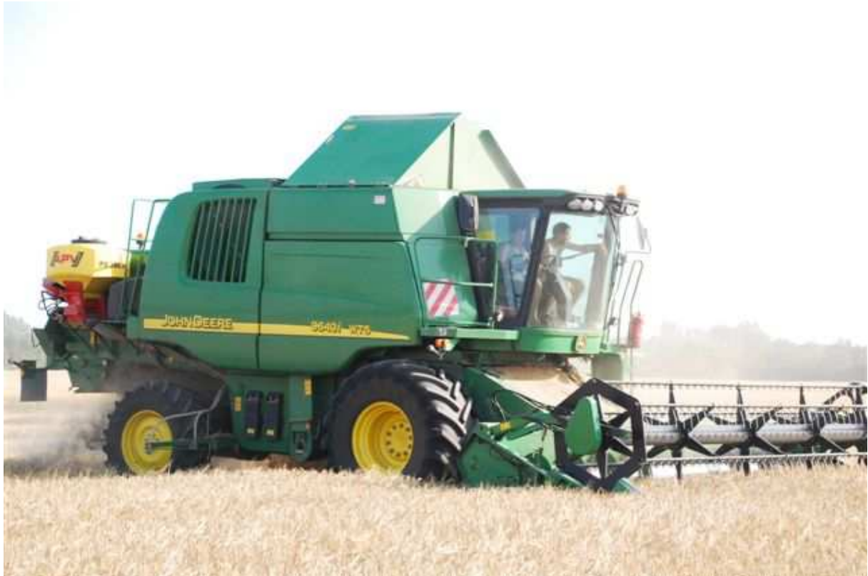
Abb.1: Saat der Zwischenfruchtmischung während des Drusches der Wintergerste am 20.6.2012

Die Bgld. Landwirtschaftskammer und die BBK Wr. Neustadt haben im Sommer 2012 einen Versuch zur Saat der Zwischenfrucht während des Drusches initiiert. Darüber wurde schon im Mitteilungsblatt der Bgld. Landwirtschaftskammer berichtet. Nachlesen können Sie dies unter www.lk-bgld.at (Grundwasserschutz).